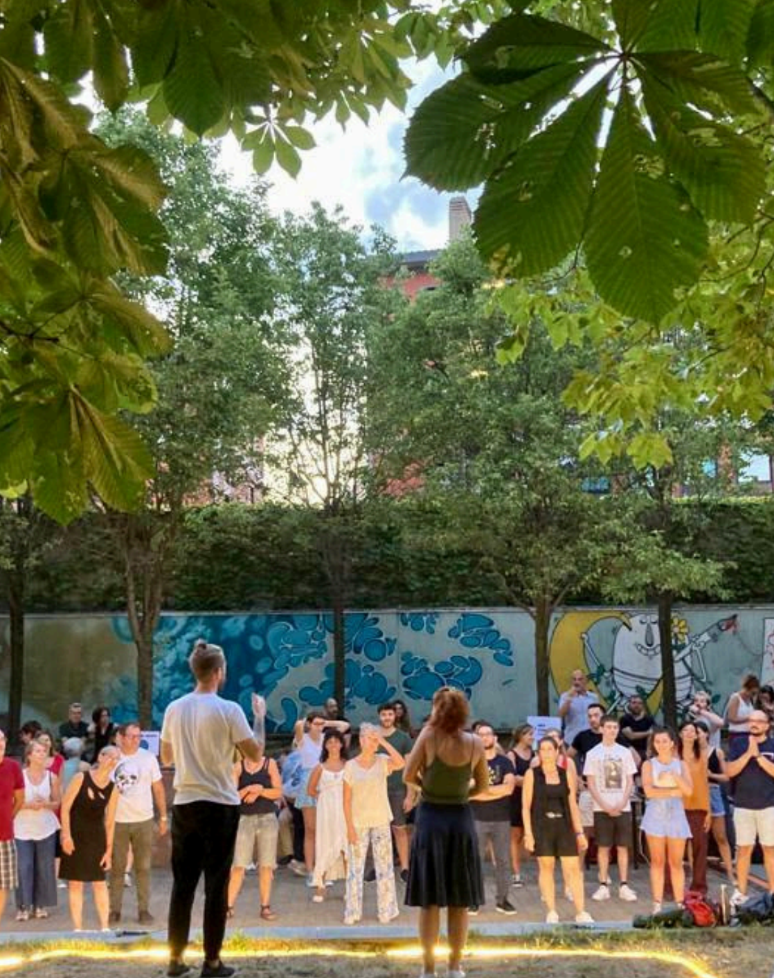
GIARDINI GILARDI - CABINA DELLA PORTINERIA DI COMUNITÀ® INSIDE OUT SCHOOL - ISS "L. LAGRANGE"