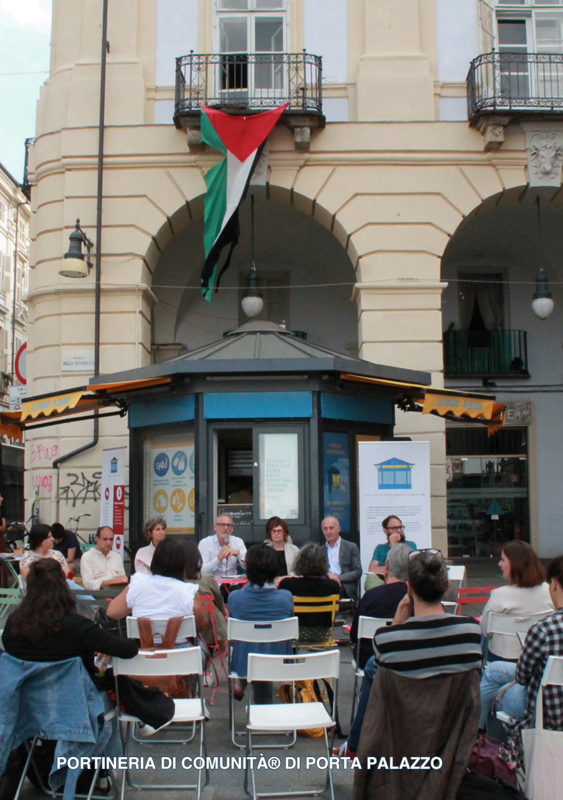
PORTINERIA DI COMUNITÀ® DI PORTA PALAZZO